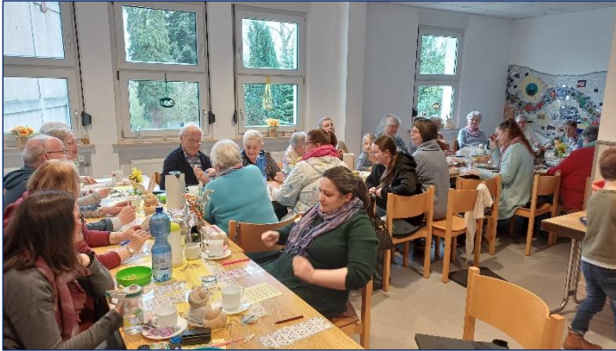
Gespannte Vorfreude auf die nächste Losnummer – wird endlich die fünfte Zahl gezogen und damit die Zeile voll?

Das zweite Highlight der Heimzeit in diesem Jahr war das diesjährige Eierlotten am 29. März. Obwohl an diesem Wochenende die Osterferien begannen, waren