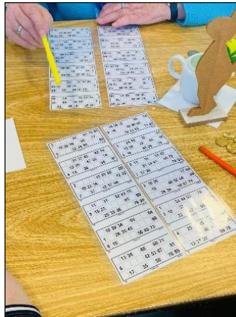
Dagmar hatte als Glücksfee reichlich zu tun. Neues Spiel, neues Glück – im Bild rechts warten die Spielbeteiligten auf das Ausrufen der ersten Losnummer der neuen Spielrunde.

tersüßigkeiten verlost. Als Bingo-Glücksfee machte es Dagmar immer wieder spannend. Das Spielfieber stieg. Wer schafft es als erster, „ Bingo “ zu rufen? Jedenfalls waren zum Ende des Nachmittags sämtliche Eierkartons und alle Süßigkeiten an die Frau, den Mann und das Kind gebracht. So ließ es sich gut in die Osterzeit starten.