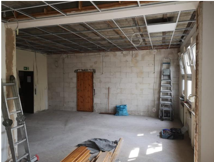
Blick in Richtung Flur und Stuhllager. Die Deckenunterkonstruktion ist fertig und die Elektroinstallation ist verlegt.

Der große Raum im Waterhüsken ist eine große Baustelle. Inzwischen sind die Decken und Wände freigelegt. Auch die Tapeten sind entfernt. Die neue Deckenkonstruktion ist montiert. Der Elektriker hat alle Kabel