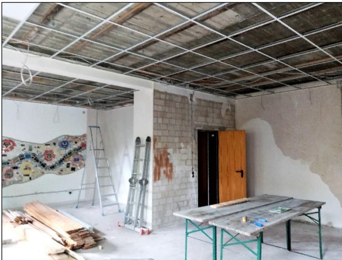
Ringsum haben die Arbeiten nackte Steinmauern und Wände hinterlassen, nur das 2016 gestaltete Mosaik ist übriggeblieben.